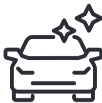
Kraft- und Nutz- fahrzeuge