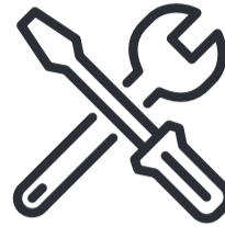
Sanitär, Heizung und Klima