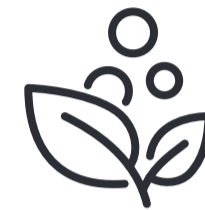
Forst- und Landwirtschaft