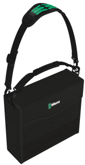
Wera 2go 2 05004351001 1 x 3-teilig