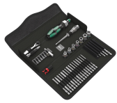
Kraftform Kompakt H1 Holz 05135939001 1) 1 x 41-teilig 05135939001 1) 1 x 41-teilig 05135939001 1) 1 x 41-teilig 05135939001 1) 1 x 41-teilig 05135939001 1) 1 x 41-teilig 05135939001 1) 1 x 41-teilig 05135939001 1) 1 x 41-teilig 05135939001 1) 1 x 41-teilig 05135939001 1) 1 x 41-teilig 05135939001 1) 1 x 41-teilig

1) Produkt nicht in den USA und Kanada erhältlich.