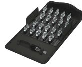
Bit-Safe 61 Wood 1 05057442001 1 x 61-teilig 05057442001 1 x 61-teilig 05057442001 1 x 61-teilig 05057442001 1 x 61-teilig