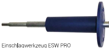
Einschlagwerkzeug ESW PRO