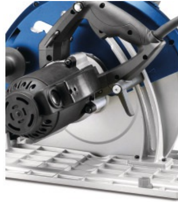
Schneidtiefeinstellung an der Rückseite