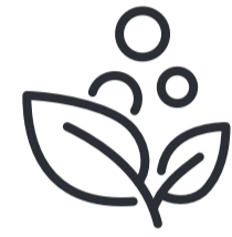
Forst- und Landwirtschaft