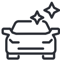
Kraft- und Nutz- fahrzeuge