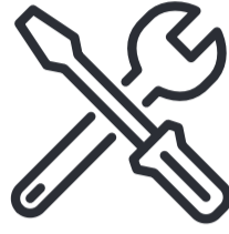
Sanitär, Heizung und Klima