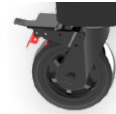
Antistatische Rollen mit Bremse