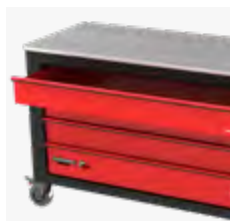
4 Schubladen jeweils bis zu 65 kg belastbar