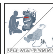
DUAL WAY CLEANING