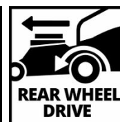
REAR WHEEL DRIVE