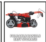
FOLDABLE HANDLE EASY STORAGE