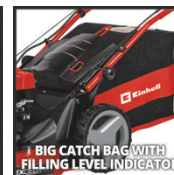
BIG CATCH BAG WITH FILLING LEVEL INDICATOR