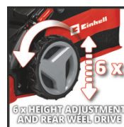
6x HEIGHT ADJUSTMENT AND REAR WHEEL DRIVE