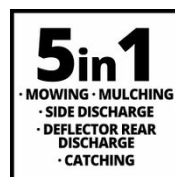
5 in 1 - MOWING - MULCHING - SIDE DISCHARGE - DEFLECTOR REAR DISCHARGE - CATCHING