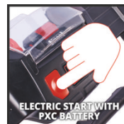
ELECTRIC START WITH PXC BATTERY