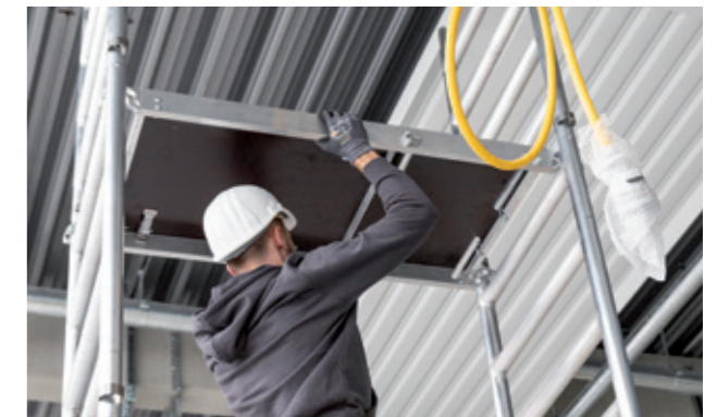
Obere Plattform einhängen