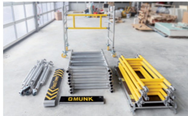
Leichtes Handling dank kompakter Einzelteile