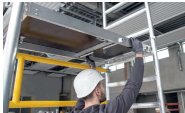
Stabile Plattformen mit Schnellverschlüssen