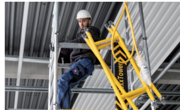
Sicherer Aufstieg dank rundum profilierter Sprossen