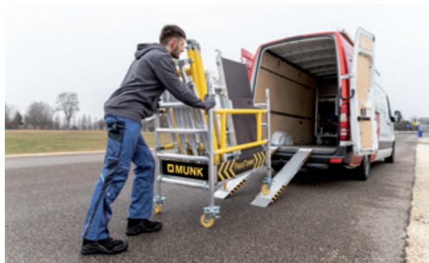
Transport in vielen gängigen Nutzfahrzeugen zum Einsatzort