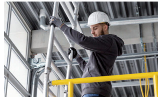
Weitere Aufsteckrahmen einsetzen