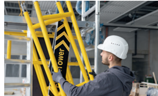
Praktische Einhängkonsole (ausziehbar) zur Mitnahme der Teile