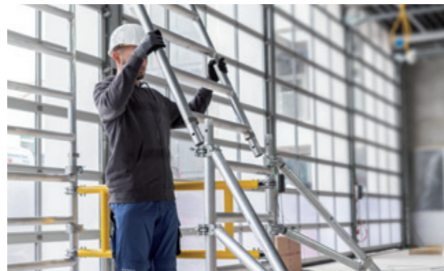
Intuitive Steckverbindungen mit Federclips