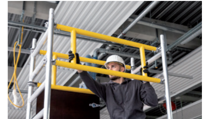
Montage im absturzesicherten Bereich dank 3-T-Methode