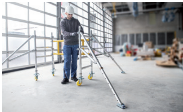
Einfache Montage der Ausleger für sicheren Stand