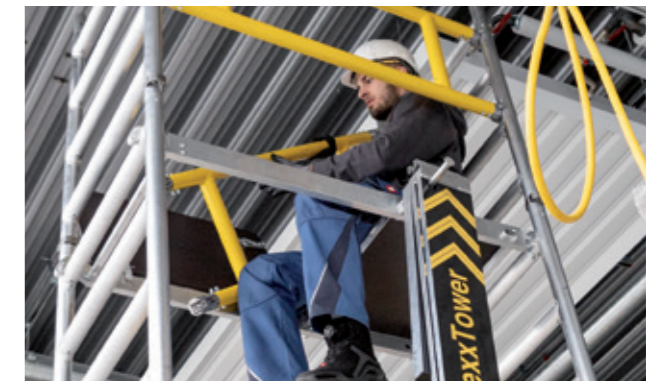
Obere Geländer und Bordbretter montieren