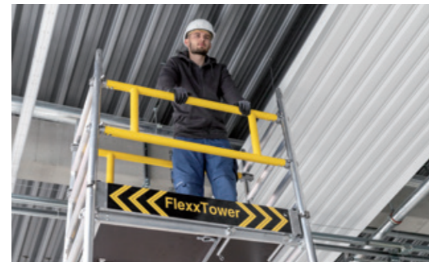
Fertig für das sichere Arbeiten in Höhen bis zu 6,10 m