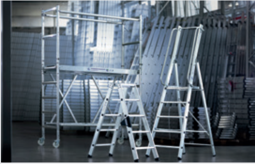
MUNK Günstzburger Steigtechnik

Die MUNK Günstzburger Steigtechnik ist eine Marke der MUNK Group und steht für Leitern, Rollgerüste und Sonderkonstruktionen in Premium-Qualität.