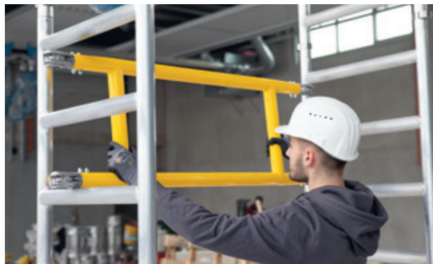
Pulverbeschichtete Geländerrahmen als Querstreben