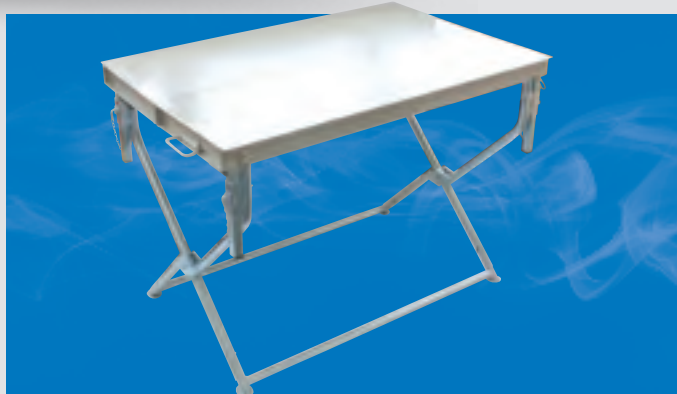
Auch als Tisch verwendbar.