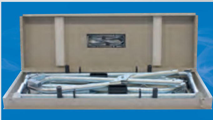
Lagerungsbock in Transportbox.