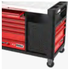
12 Schubladen jeweils bis zu 50 kg belastbar