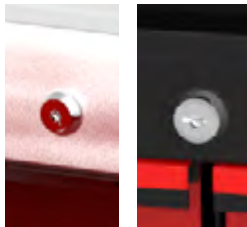
2 Schlösser abschließbar