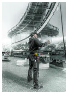
Schraubendrehersätze Gürteltasche in