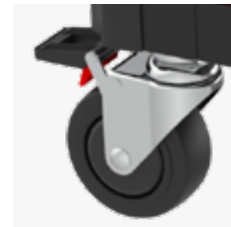
Antistatische Rollen mit Bremse