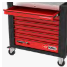
8 Schubladen jeweils bis zu 50 kg belastbar