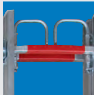
inklusive Einhängebügel mit automatischer Sicherung