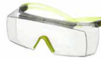
SF3701SGAF-GRN Scheibe: Klar Rahmenfarbe: Grau/lindgrün