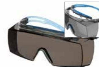
SF3702XSGAF-BLU Scheibe: Grau Rahmenfarbe: Grau/blau