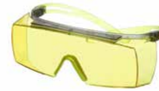
SF3703SGAF-GRN Scheibe: Gelb Rahmenfarbe: Grau/lindgrün