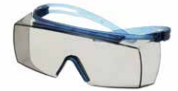
SF3707SGAF-BLU Scheibe: graue Scheibe für Innen-/Außenbereich Rahmenfarbe: Blau/blau