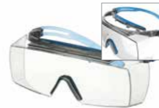
SF3701XSGAF-BLU Scheibe: Klar Rahmenfarbe: Grau/blau