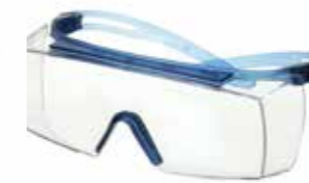
SF3701SGAF-BLU Scheibe: Klar Rahmenfarbe: Blau/blau