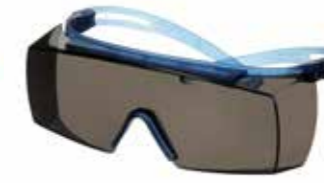
SF3702SGAF-BLU Scheibe: Grau Rahmenfarbe: Blau/blau