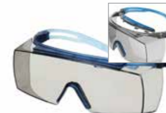
SF3707XSGAF-BLU Scheibe: I/A Grau Rahmenfarbe: Grau/blau