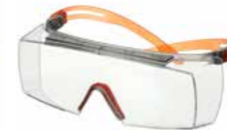
SF3701SGAF-ORG Scheibe: Klar Rahmenfarbe: Grau/orange