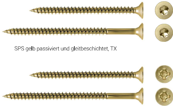
SPS gelb passiviert und gleitbeschichtet, TX