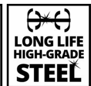
LONG LIFE HIGH-GRADE STEEL