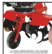
6 CULTIVATOR BLADES