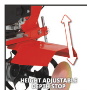
HEIGHT ADJUSTABLE DEPTH STOP