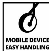
MOBILE DEVICE EASY HANDLING