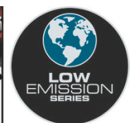
LOW EMISSION SERIES