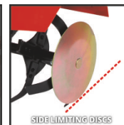
SIDE LIMITING DISCS