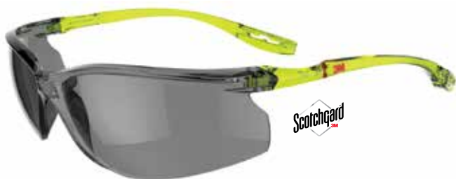
SCCS02SGAF-GRN Scheibe: Grau