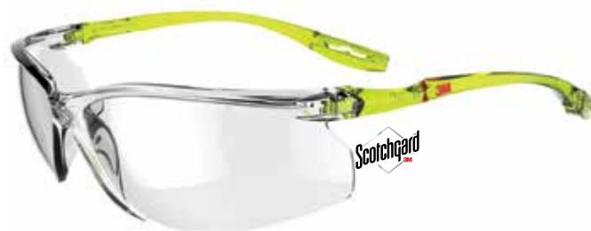
SCCS01SGAF-GRN Scheibe: Klar