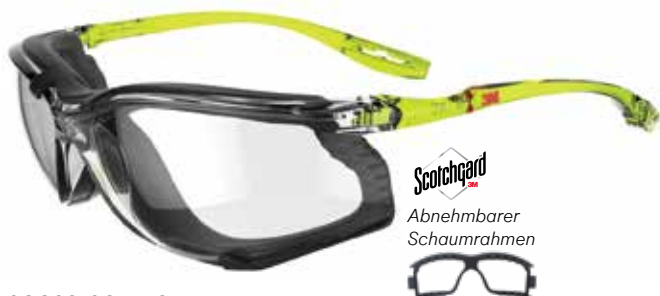
SCCS01SGAF-GRN-F Scheibe: Klar