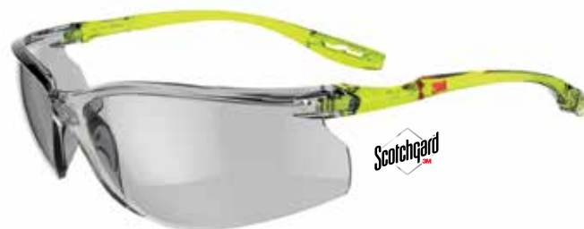
SCCS07SGAF-GRN Scheibe: hellgraue Scheibe für Innen-/Außenbereich (Indoor/Outdoor)