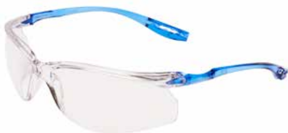
71511-00000 Scheibe: Klar