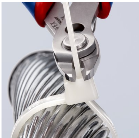
zum bündigen Schneiden, z. B. zum Einkürzen von Kabelbindern