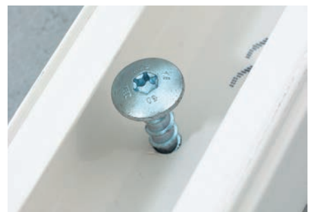
Befestigung von Montageschienen