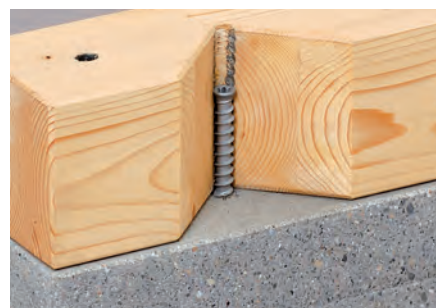
Holzmontagen auf Beton