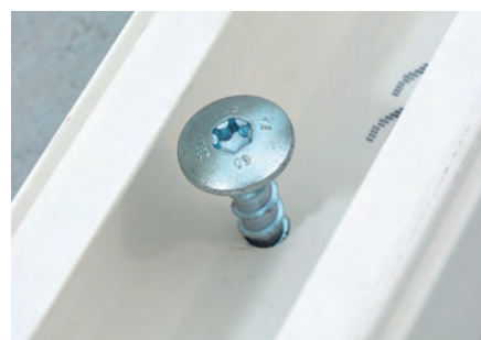
Befestigung von Montageschienen